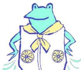
ファン付きウェア、 ネッククーラー